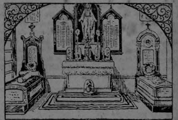
La Capilla de la Casa Madre de Angers donde fue sepultada la santa fundadora del Buen Pastor.

Murió en Angers el 24 de abril de 1868, hacia las 6 de la tarde, tras crueles sufrimientos, llevados con heroico valor. Dejó una obra imperecedera de bien, de amor a la humanidad.